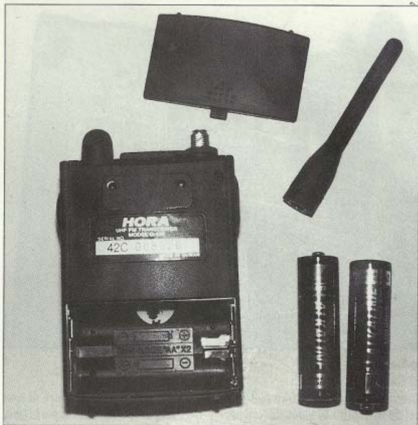
② Vano batterie

Non è cattiva idea dissaldare il diodo con un saldatore (max 30 W) ben caldo ma staccato dalla rete, e