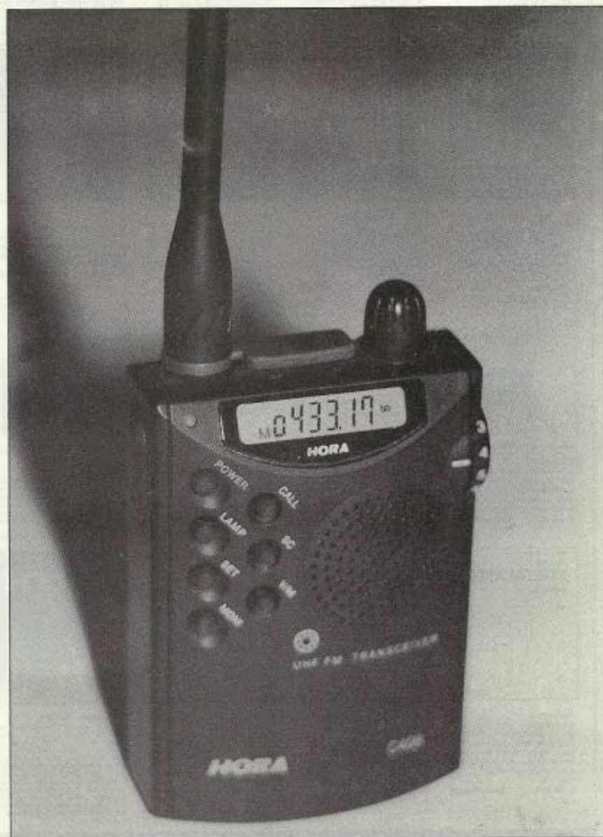
Ⓐ RTX HORA C-408

Confesso anzi, che già durante il viaggio di ritorno dalla fiera, dove ho commesso l'ultimo... «acquisto», seduto comodamente nel sedile posteriore dell'auto che mi riporta a casa, non ho perso tempo e, sordo alle chiacchiere degli amici, mi sono messo a studiare le possibilità del mio nuovo palmirino. È un portatile da taschino monobanda UHF con copertura ufficiale da 430 a 440 Mhz FM, con potenza d'uscita di 230 mW, subtoni per ingresso ponti, antennino in gomma con connettore SMA, ed alimentazione con due pile da 1,5 V size AA alcaline (foto 1). Il bello è che le dimensioni sono 5,8 x 8 x 2,5 cm, roba che scompare dentro al taschino della camicia senza lasciare traccia... La marca mi è sconosciuta, HORA non l'ho mai vista nella pubblicità che di solito mi passa sotto gli occhi, ma l'aspetto è lo stesso dello Standard C-108 VHF ed il libretto istruzioni non è marcato, ma è intitolato solo Owner's manual.