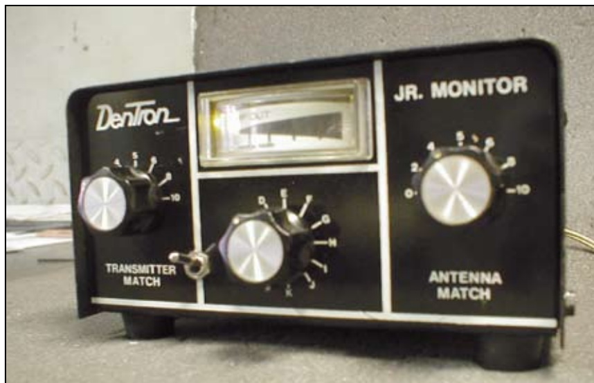
Foto 1 - L'accordatore già chiuso

Come abbiamo detto la commutazione è affidata a un relè a doppio scambio, nel caso l'impiego sia per potenze maggiori ricorreremo a due relè a un solo